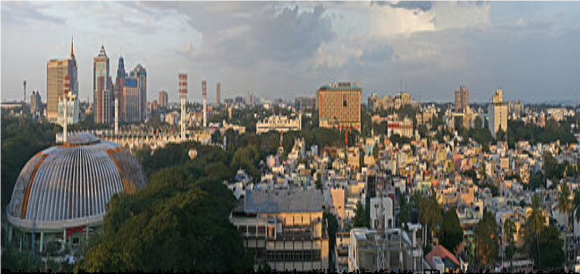
Widok z lotu z powietrza na miasto i nowoczesny stadion.