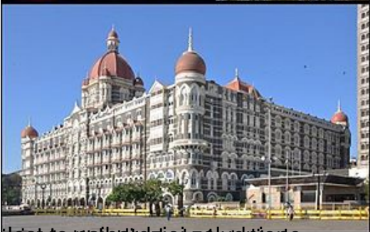
Widok na hotel Taj Mahal Palace i wieżę zegarową.