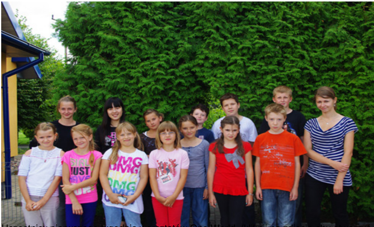
Uczestnicy pierwszego tygodnia warsztatów One World (kliknij w zdjęcie aby otworzyć galerię)