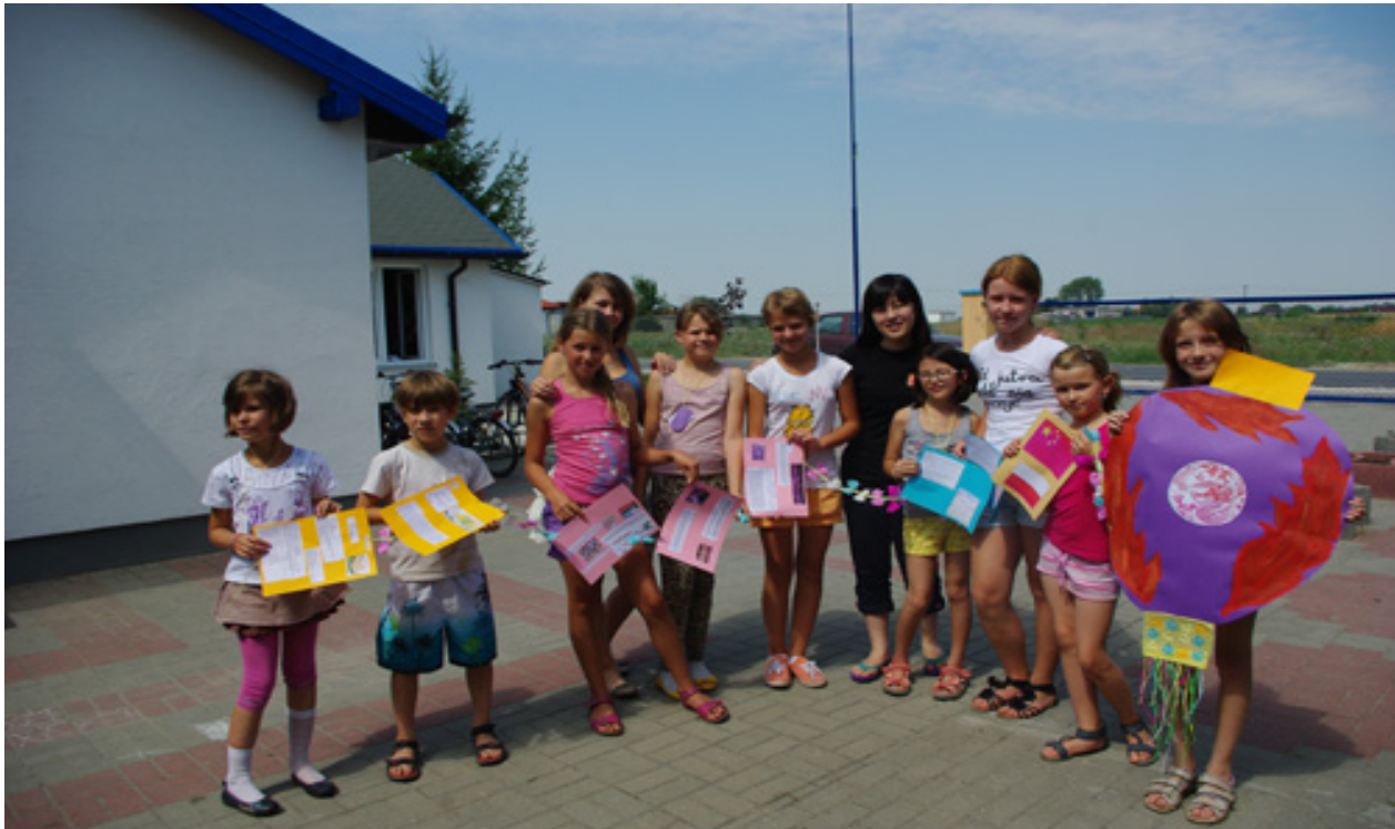
blazeńscy dziecięcej grupy warsztatów, która wykonała chiński latawiec. (kliknij na zdjęcie aby