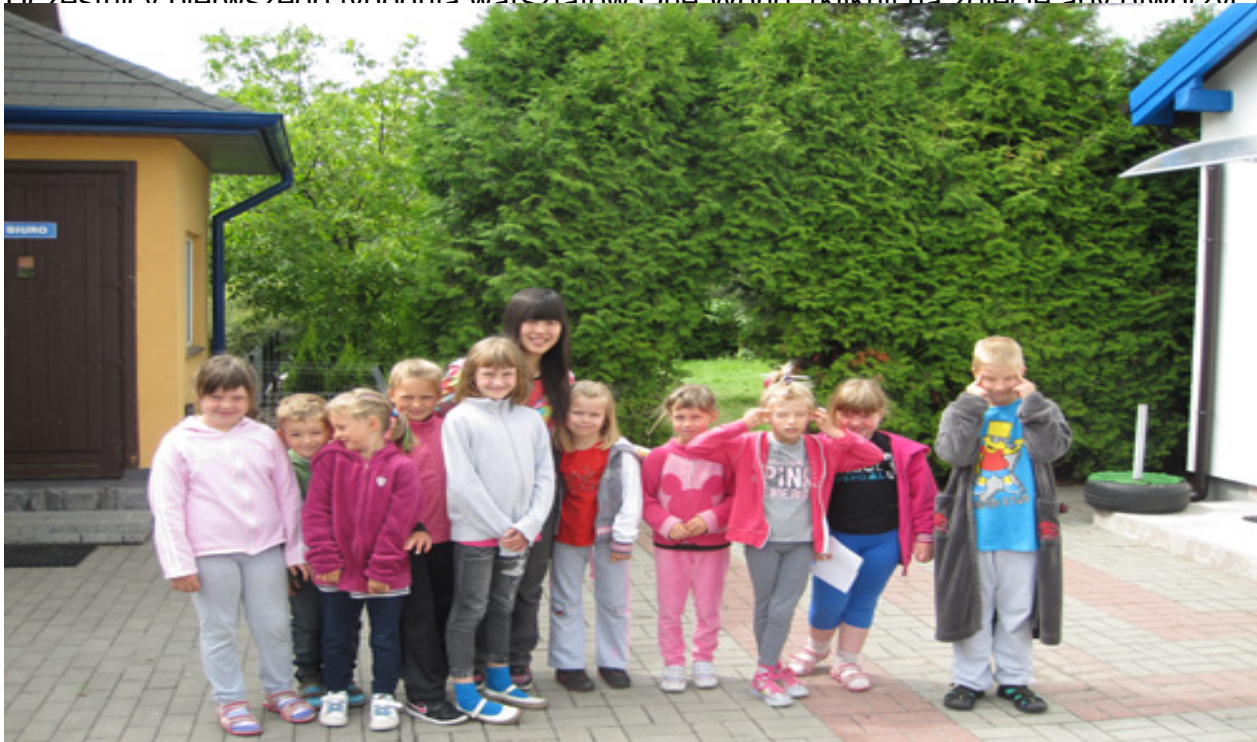
Wyniki konkursu rysunków na zakończenie warsztatów (kliknij w zdjęcie aby otworzyć galerię)